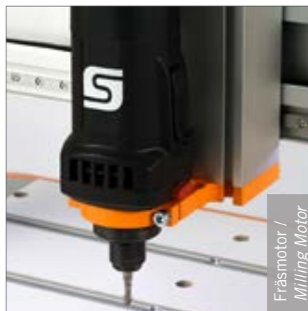
Fräsmotor / Milling Motor