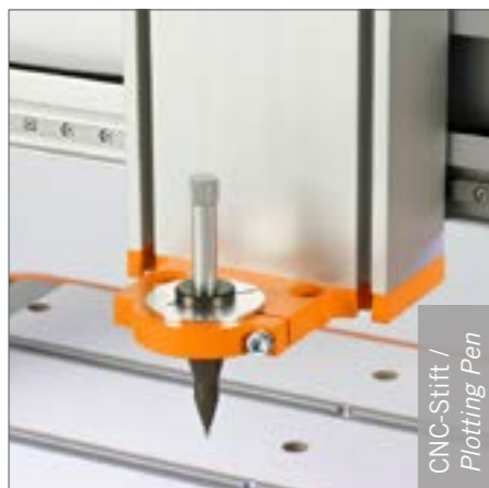
CNC-Stift / Plotting Pen