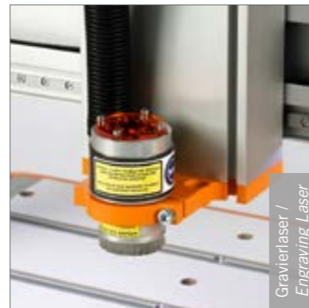
Gravierlaser / Engraving Laser