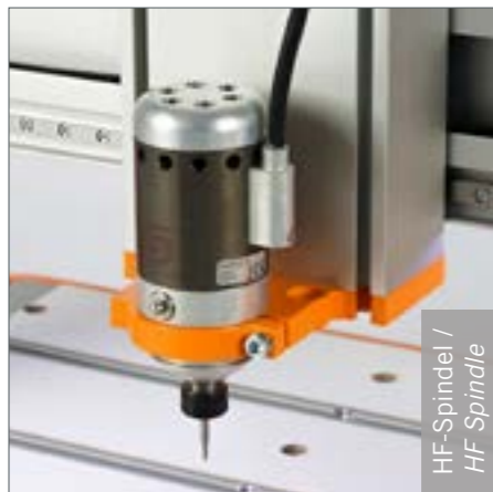
HF-Spindel / HF Spindle