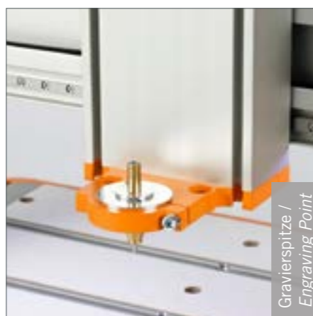
Gravierspitze / Engraving Point