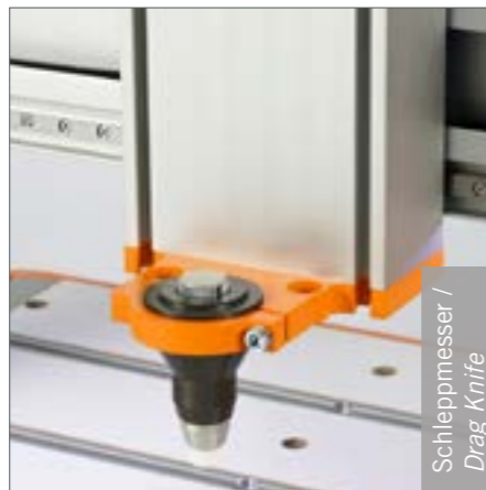
Schleppmesser / Drag Knife