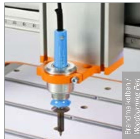
Brandmaalkolben / Woodburning Pen